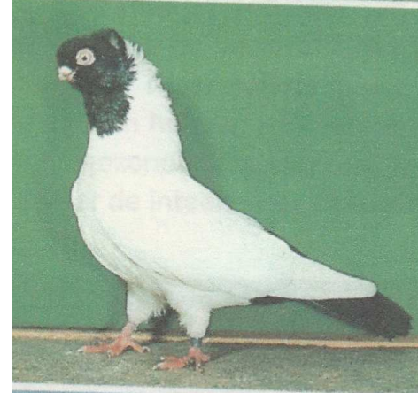
POSENER KLEURKOP. ZWART.