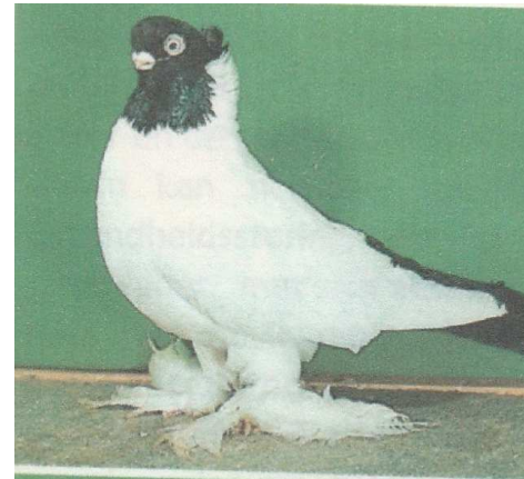
KONINGSBERGER KLEURKOP. ZWART.